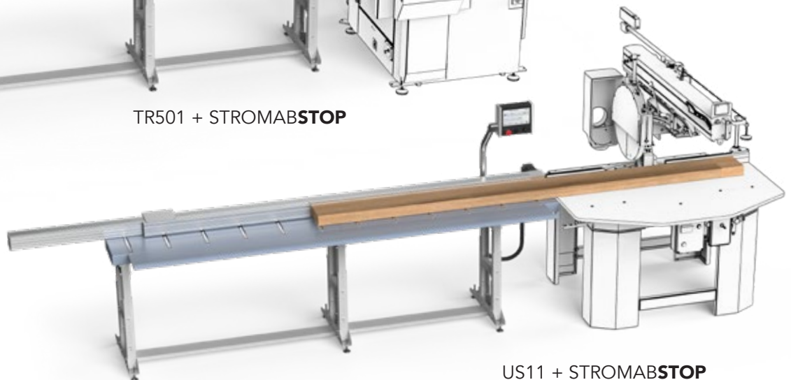
US11 + STROMABSTOP