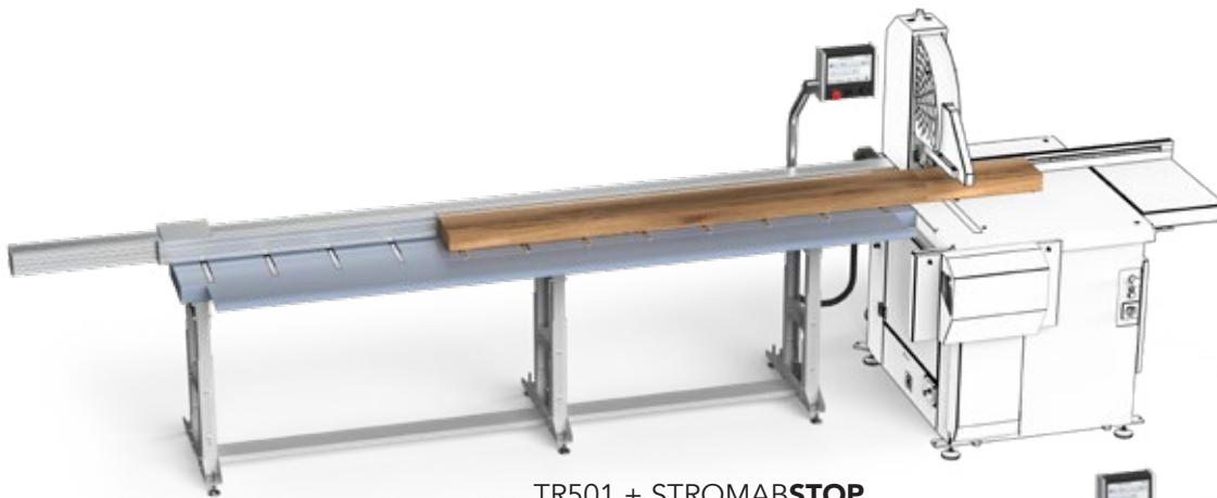
TR501 + STROMABSTOP